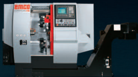
HYPERTURN 45 Hochleistungs-Drehzentrum für die Komplettbearbeitung