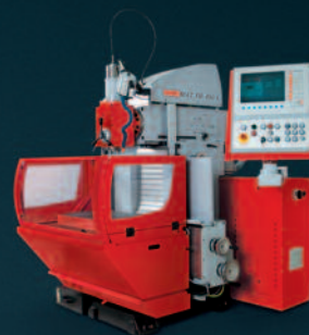
EMCOMAT FB 450-L Universal Werkzeugfräsmaschine mit EMCO-eigener Zyklensteuerung